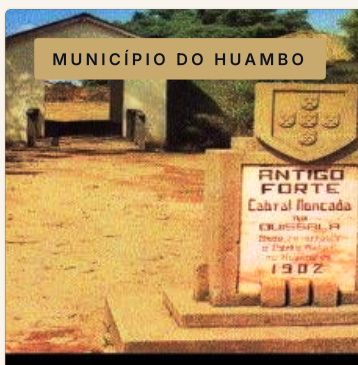
MUNICÍPIO DO HUAMBO

A 8 km a norte da Vila Municipal, a Missão Católica de Camela encanta não só pela sua vertente religiosa mas também científica. Um local de encontro entre a espiritualidade, a história colonial e o saber, num ambiente de serena beleza.