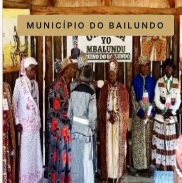
MUNICÍPIO DO BAILUNDO