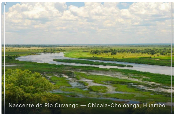
Nascente do Rio Cuvango — Chicala-Choloanga, Huambo

Choloanga é uma jóia natural ainda pouco explorada pelo turismo, onde a água brota da terra para iniciar uma viagem épica até ao Delta do Okavango no Botswana — Patrimônio Mundial da UNESCO.