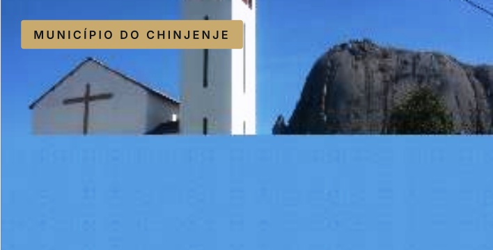
MUNICÍPIO DO CHINJENJE