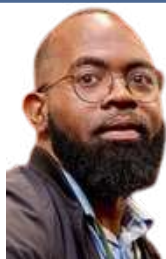
Por: Alexandre Sousa Técnico de Comunicação