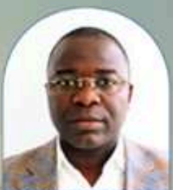
DOMINGOS MARTINS 02/06 DNFCL