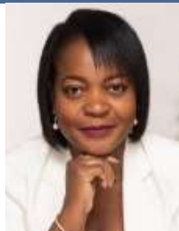
Por: Alcina Parreira,

Mestre em Estratégia de Investimento e Internacionalização