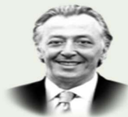
HAFED AL-GHWEL 03 de maio de 2025