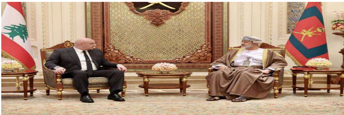
Joseph Aoun e Sultan Haitham bin Tariq.

O Presidente libanês Joseph Aoun e seu homólogo Omenense, Sultan Haitham bin Tariq, fizeram ontem um apelo conjunto para a suspensão imediata dos ataques israelenses ao território libanês e a retirada total de todas as terras árabes ocupadas, alertando que as violações contínuas representam uma ameaça directa à estabilidade regional. A declaração foi feita durante uma cúpula de alto nível em Mascate, onde ambos os líderes expressaram "séria preocupação com a agressão israelense em andamento" e descreveram a ocupação como uma "clara violação" da Resolução 1701 do Conselho de Segurança da ONU e de outras resoluções internacionais. Os dois lados também expressaram apoio aos esforços internacionais para desescalar tensões, estabilizar a situação no terreno, facilitar o retorno de pessoas deslocadas e avançar na reconstrução pós-conflito.