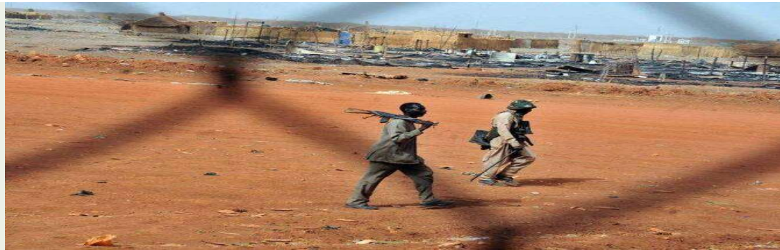
Soldados sudaneses caminham na cidade petrolífera de Heglig.

O Sudão do Sul enviou suas tropas para o vizinho Sudão para proteger o estratégico campo petrolífero de Heglig próximo à fronteira, disse ontem o seu chefe militar, dias após as Forças Paramilitares de Apoio Rápido (RSF) assumirem o controle do país.