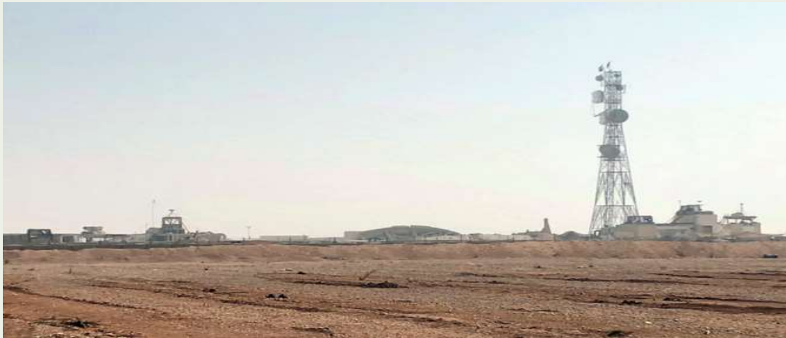
O posto militar Al-Tanf no sul da Síria em 2018.