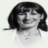
RACHEL REEVES 28 de outubro de 2025